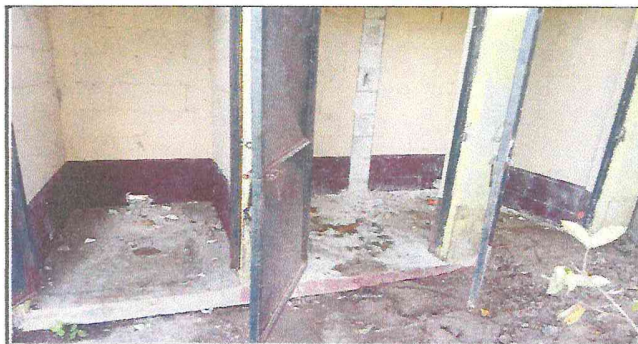
Foto 5: cambio de letrinas por inodoro con sus accesorios, tubería de agua negra y potable,