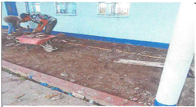
Foto 3: cambio de piso de granito por piso de cemento alisado color rojo